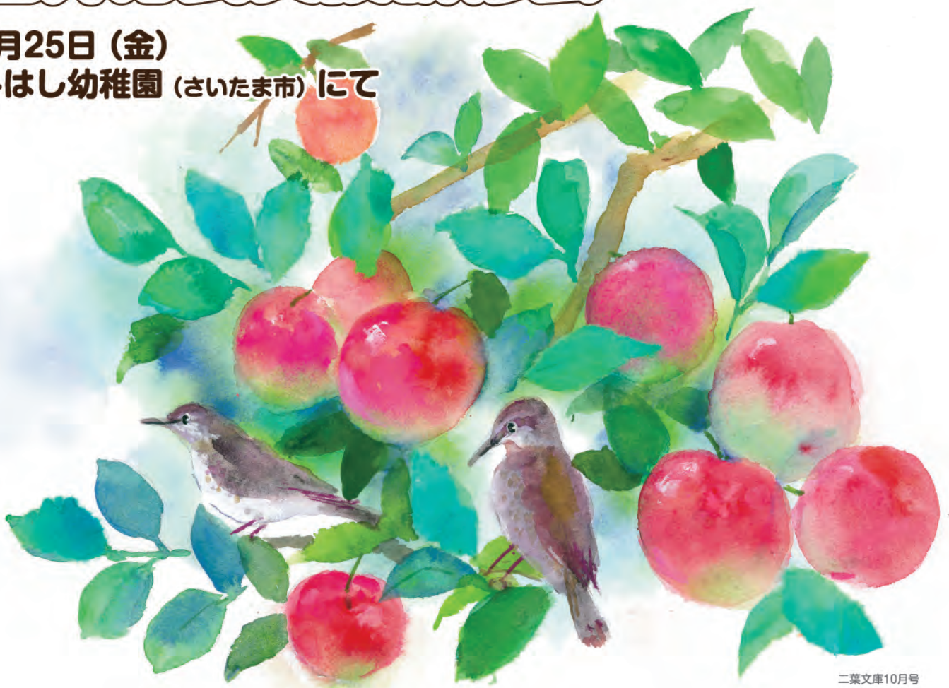
二葉文庫10月号 『りんりん林檎の』